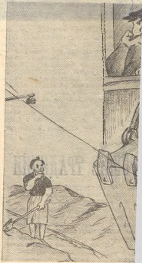
Таковую картину увидите часто.

Однако это ни в коей мере не относится к Кедровскому карьеру, где вот уже несколько лет подряд лопата в руках путевого рабочего безуспешно пытается выйти победителем против механической лопаты,